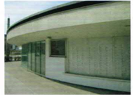
Postfiliale Hötting-West, heute.

Deshalb ist es so wichtig, dass die repräsentative Demokratie die Bereitschaft der BürgerInnen zu zivil-